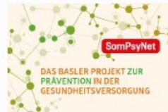
Was ist SomPsyNet?