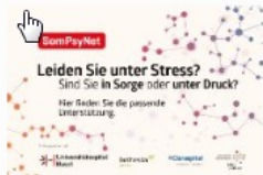
Angebotsplattform - Hier finden Sie Unterstützung