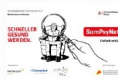
Erklärvideo zu SomPsyNet